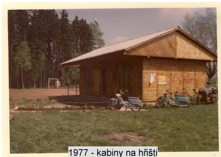
1977 - kabiny na hřišti

Obec využívala areál i pro pořádání dětských dnů. Čtvrtého června 1972 byl velký dětský den s průvodem od hospody u Vaníčků (křižovatka v H. Rybníkách) na hřiště. Na programu bylo slavnostní otevření kabin a jejich uvedení do provozu, vystoupení dětí z MŠ a ZŠ, finálové utkání žákovského oddílu kopané. Přistání vrtulníku.