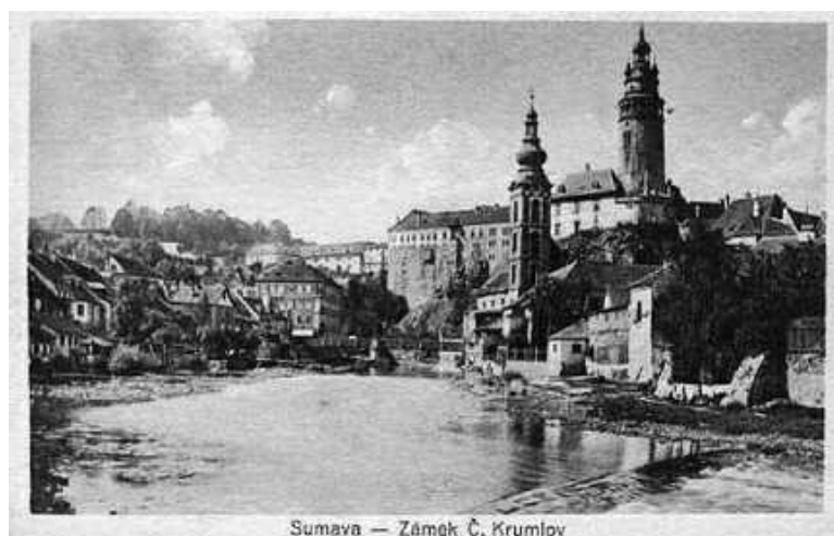
Pohlednice z roku 1926